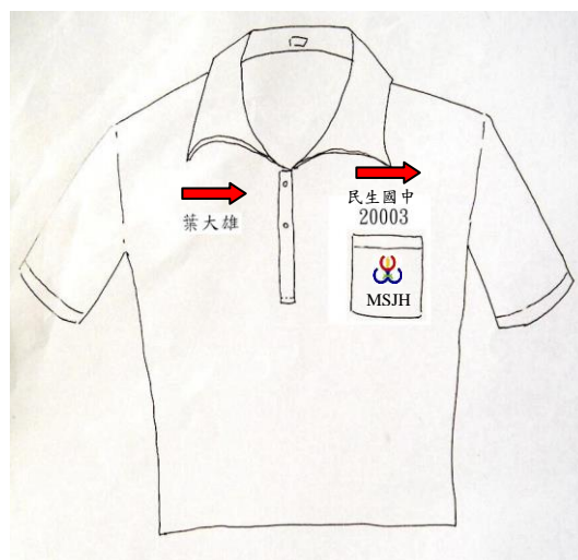
運動服(校名、學號、姓名) (字體為標楷體，由左至右)