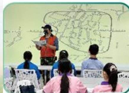
在地踏查/嘉義小旅行、鳳梨會社