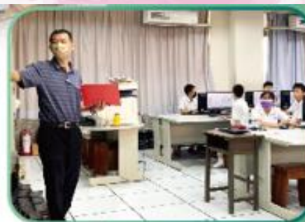
資訊課程融入雙語