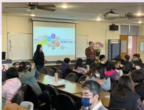
*國際教育增能研習