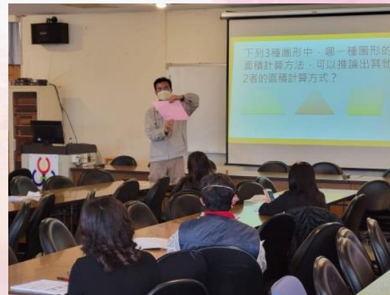
*親師家長增能-遇見 108 課綱