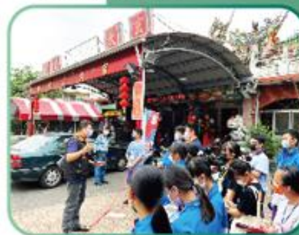
在地踏查玄天上帝秋穫節