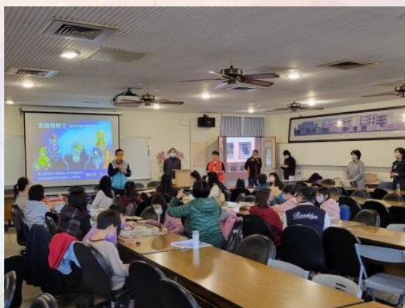
*親師家長增能-金融教育