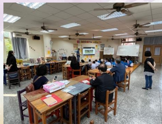
*外師訪視-確保教學品質