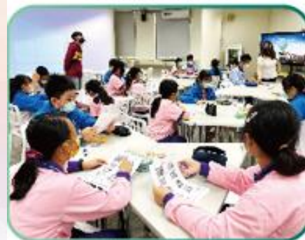
國際教育走讀城市