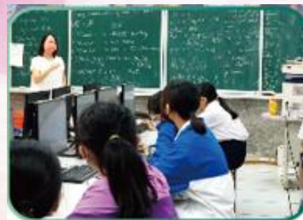
資訊課程融入雙語